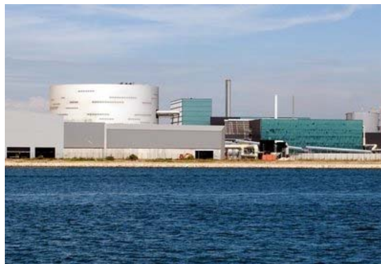
300 000 tonnes de déchets sont incinérées par Urbaser dans l'usine de Fos.

Mise en service début 2010, l'usine de Fos-sur-Mer qui traite les ordures ménagères de la communauté urbaine Marseille Provence Métropole doit-elle augmenter sa capacité administrative d'incinération, en la faisant passer de 300 000 à 360 000 tonnes, plus 110 000 tonnes destinées au circuit de méthanisation ? Société espagnole qui a remporté en 2005 le marché de l'exploitation et de la construction du site, Urbaser avait évoqué cette possibilité dès 2010 avec les services de l'État, ce qui lui avait alors été refusé. Elle est toutefois revenue à la charge mi-2011, en déposant une demande officielle, d'où l'ouverture d'une enquête publique : elle s'est déroulée du 15 novembre au 15 décembre et ses conclusions ne sont pas encore connues.